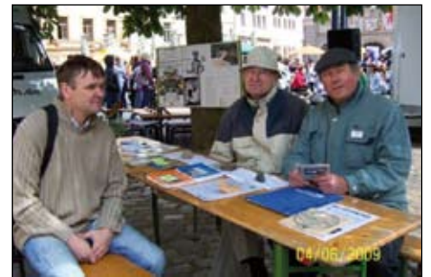
Juni, Gotha, Weltumwelttag, lokale Agenda.