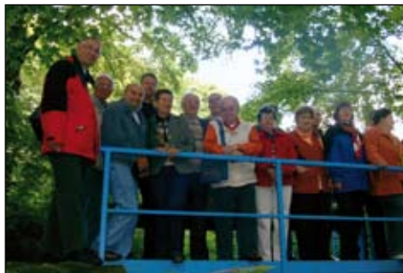
Juni, Georgenthal, MDR-Termin am Teiler.