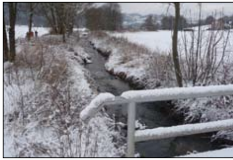
Februar, Kahla, Exkursion zum Oberbach.