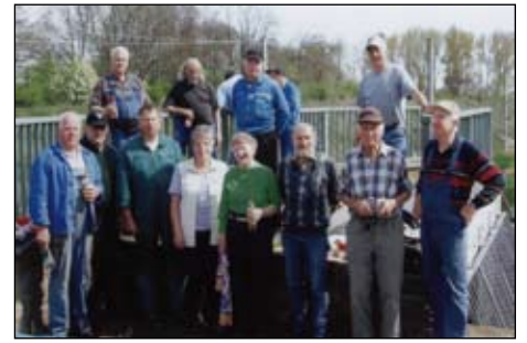
März, Aquädukt, traditioneller Subbotnik.