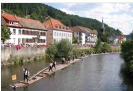
September, Wolfach (Schwarzwald), 22. Deutscher Flößertag, Schauflößen des Flößervereins.