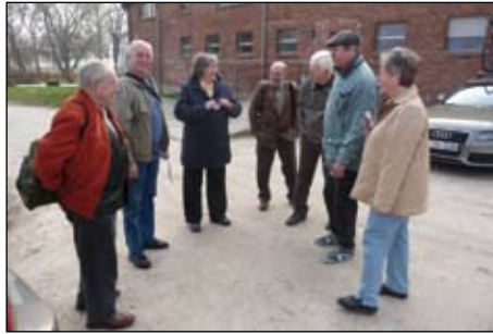
April, Creuzburg, Saline Wilhelmglücksbrunn.