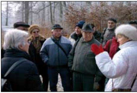
Januar, Gotha, Rundgang im Schloss-Park.