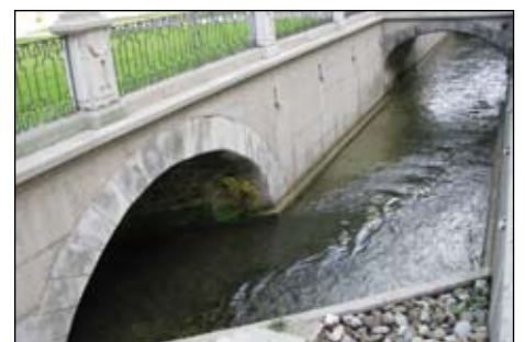
Oktober, Ravensburg, 17. Fachtagung der DWhG, Kanal im Schloss Salem.