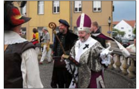
Mai, Gotha, Gothardusfest, Balthasar (Mitte).