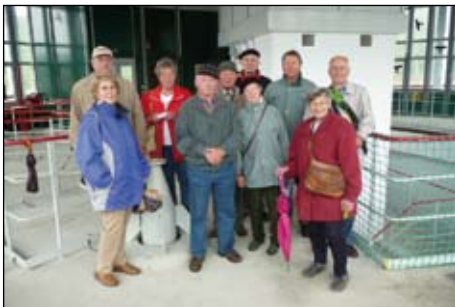
Mai, Tambach-D., Schmalwassertalsperre.