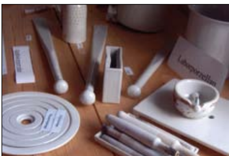
Juli, Elgersburg, Massemühle und Porzellanfabrik.