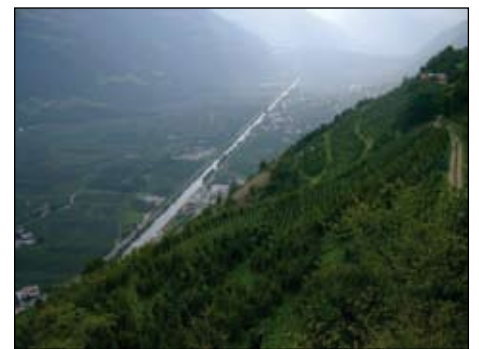
Vinschgau mit Obstplantagen im Tal der Etsch.

Am anderen Tag besuchten wir das Freilichtmuseum ‚Acheo Parc‘ in Madonna (zu deutsch