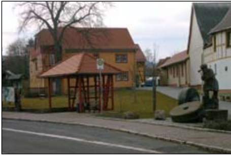
März, Crawinkel, Frühjahrs-Heimattreff.